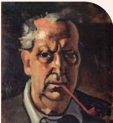
Autoportrait à la pipe André Derain

Si vous voulez rejoindre l'association, pour aider à la diffusion de l'œuvre de l'artiste et bénéficier des avantages réservés à ses membres, vous pouvez adhérer par courrier en écrivant à Association des amis d'André Derain, 38 rue de la Jonquière, 75017 Paris.