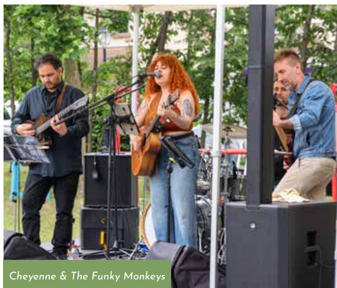
Cheyenne & The Funky Monkeys

Le 29 juin , de nombreuses animations, un concert de Cheyenne & The Funky Monkeys et un magnifique spectacle de la Compagnie Remue Ménage vous ont régales pour commencer l'été en fête !