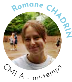
CM1 A - mi-temps

Remplaçante, en attendant le retour de Mme TOURNU