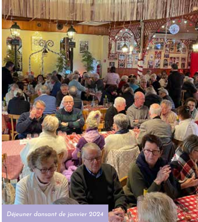
Déjeuner dansant de janvier 2024

Goûter intergénérationnel Salle Hubert Yencesse | Entrée libre