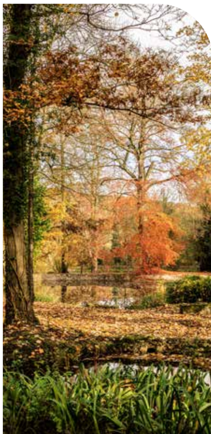
Le Désert de Retz en automne - Nicolas Vercelino

De 10h à 16h Verger de la Marnière Entrée libre Par la Mairie, les Croqueurs de Pommes et Chambourcy Ville Fleurie > page 24