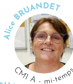
CM1 A - mi-temps

Remplaçant, en attendant le retour de Mme GRANJON