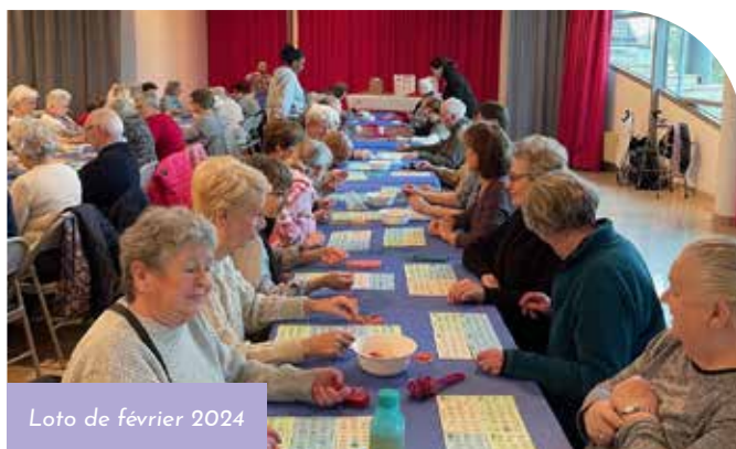
Loto de février 2024