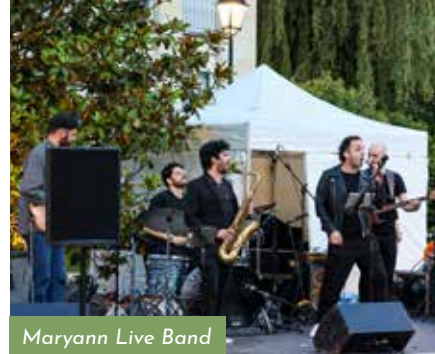
Maryann Live Band